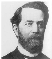
Felix Klein (1849 - 1925)

La función j induce SL_2(\mathbb{Z}) \backslash \mathbb{H} \simeq \mathbb{C} y es compatible con interpretación modular: